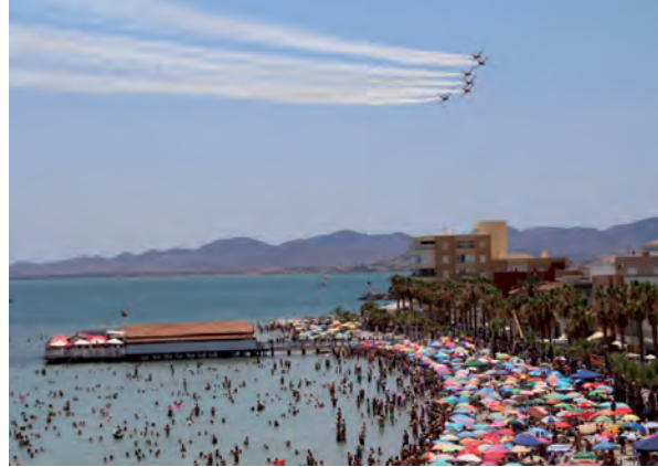
Fiesta del aire – 28 junio 2015 Centenario del Aeródromo y de la Hidroaviación Militar española

El mosaico cultural de Los Alcázares, abierto a todos los vientos y a todos los mares hace posible el crecimiento del gran árbol de la convivencia y a su sombra crece entre las buenas gentes la amistad, el respeto y la solidaridad.