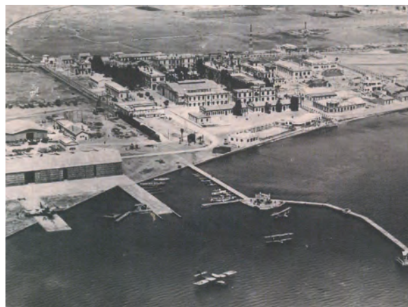
Hidroaviones en el Mar Menor – 1946