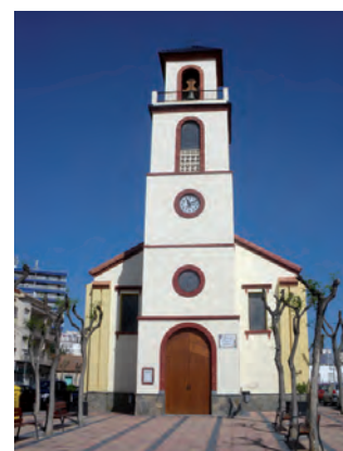
Foto de portada: Iglesia parroquial de Nuestra Señora de la Asunción

En el mismo lugar que ocupa la parroquia existía una pequeña ermita en la que los asistentes debían permanecer en la calle para oír la Santa Misa. Coincidiendo con el apogeo de la minería de La Unión la población de Los Alcázares creció de forma considerable y se hizo necesario construir un nuevo templo, así que un grupo de veraneantes y el párroco de Roda, a cuya jurisdicción pertenecía el poblado de Los Alcázares en el año 1898, pusieron la primera piedra de la actual iglesia que quedaría finalizada en 1905. El año 1953 se construyó el campanario. En 1970 se amplió el templo en 60 metros cuadrados y pasó a constituirse en parroquia.